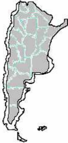
MAPA n° 9 Loxosceles laeta y Latrodectus