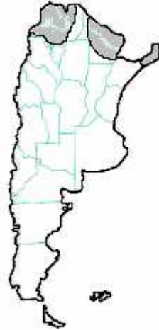
MAPA n° 12 Phoneutria