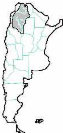
MAPA n° 11 Tityus confluens